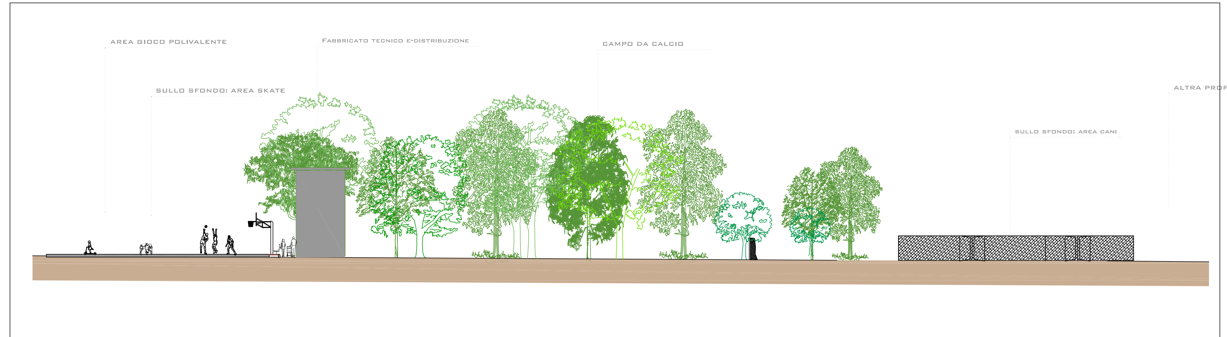
SCALA GRAFICA 1:500