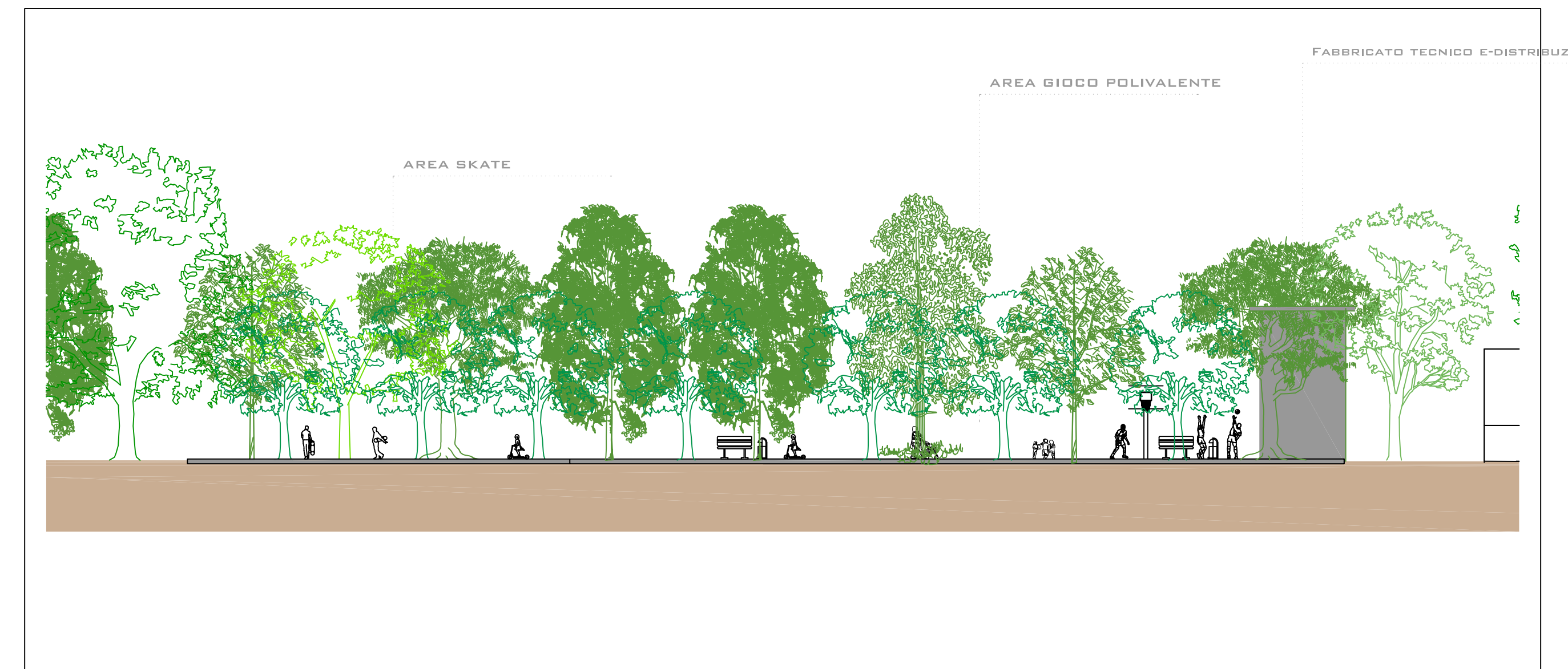
SCALA GRAFICA 1:500