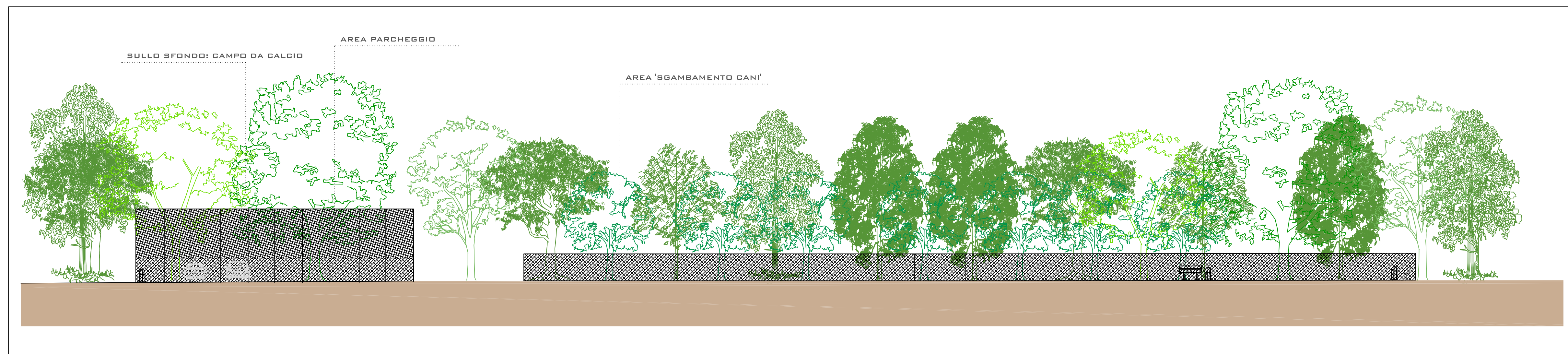
SCALA GRAFICA 1:500